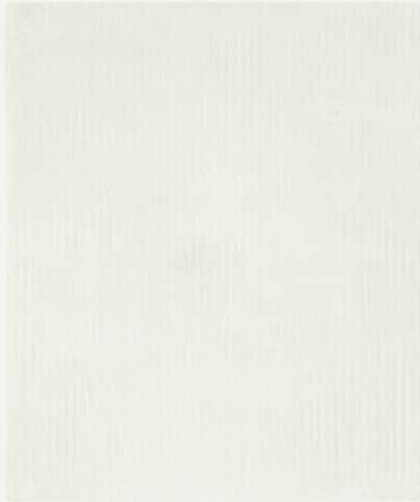
1995, olej na płótnie, 180 x 150 cm.