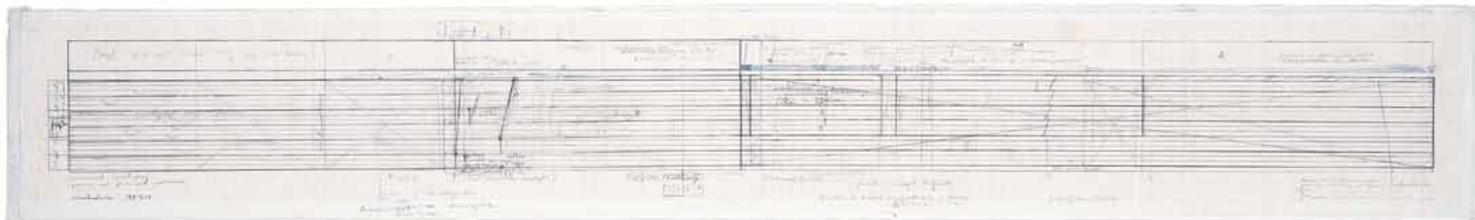
1994, partytura do instalacji bewegungen | poruszenia , technika mieszana na papierze, 30 x 145 cm. [przebieg 10 synchronicznych filmów w czasie 60 minut].