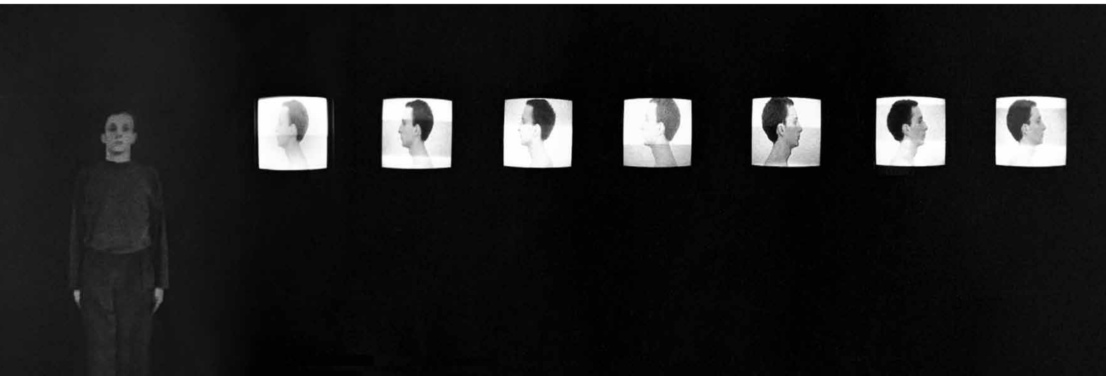
1994, bewegungen | poruszenia , multimedia performance, galerie der hochschule für grafik und buchkunst leipzig.