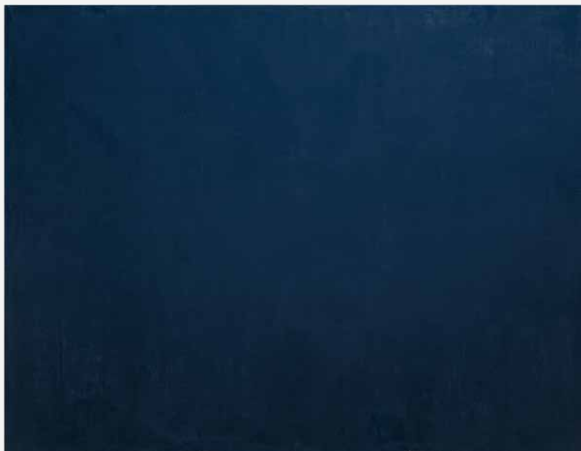
1996, olej na płótnie, 150 x 220 cm.