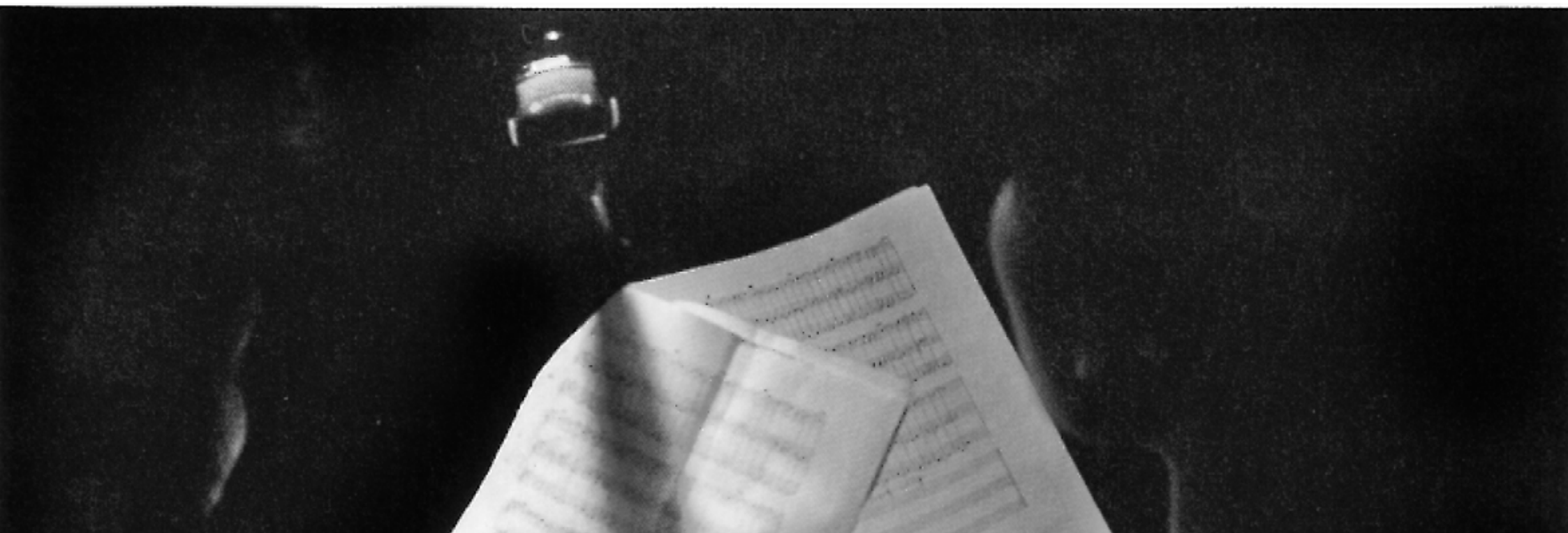
1994, bewegungen | poruszenia , multimedia performance, galerie der hochschule für grafik und buchkunst leipzig..