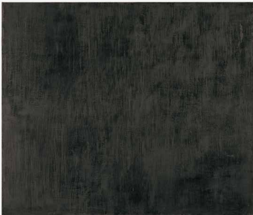
1995, olej na płótnie, 150 x 200 cm.