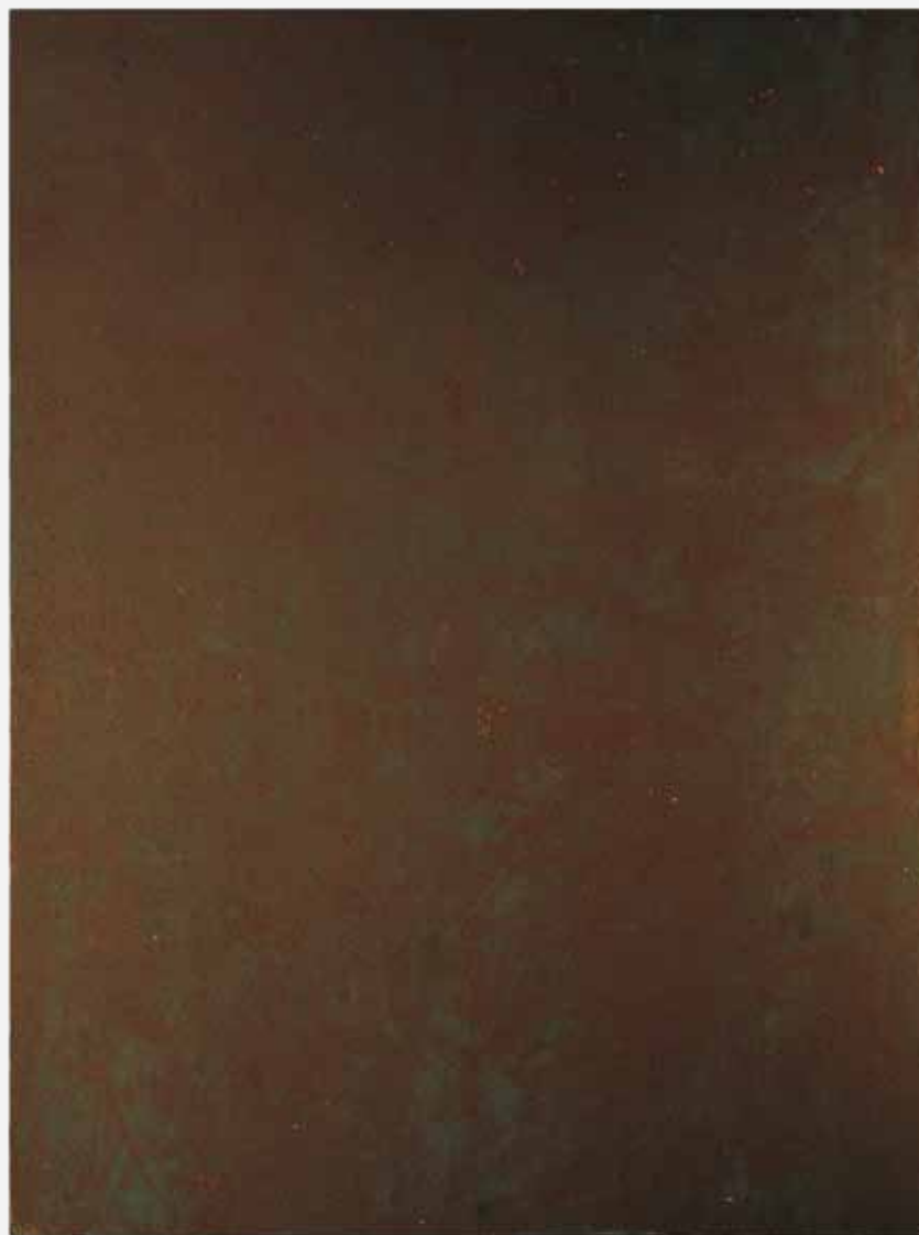
1996, olej na płótnie, 200 x 150 cm.